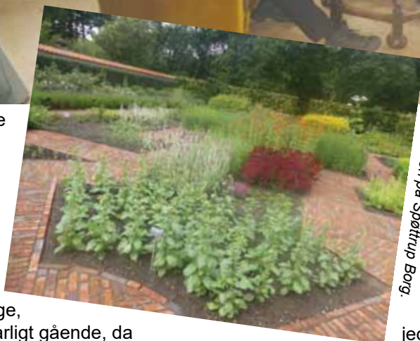
Urtehaven på Spøttrup Borg.

Naturkraft har mange kørestole, der kan lånes kvit og frit. Også her var der bestilt rundvisning med guider. Hold da op sikken service, vores guide (en sej lille pige) fandt en kørestol til en dårligt gående, og sagde, så skubber jeg, og I følger bare efter.