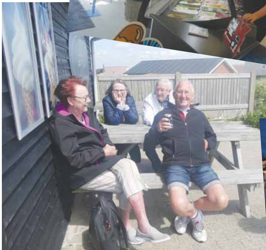
Ispause i Thorsminde.

trøstpræmie for ændringen i dagen program - en stor is, når vi kom til Thorsminde. Det var blæsevej og solen skinnede dejligt, så oplevelsen af en tur til Vesterhavet var perfekt. Der opstod et problem. Det er ret besværligt for mange at vælge en is her og nu. Så der var kun et valg - en isvaffle med 2 kugler - dog efter eget valg. I storbyerne kan de lære noget fra iskiosken i Thorsminde om god service og størrelsen på en iskugle. Efter overholdelse af CORONA regler fik alle en vaffel med to iskugler - enkelte fik en vaffel med soft ice. To iskugler i Thorsminde svarer til mindst 3 Københavnerkugler.