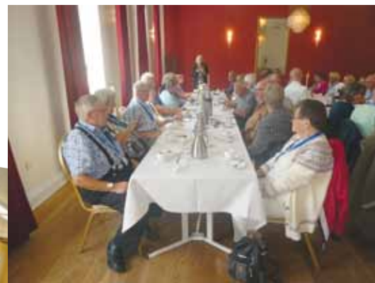
Lagkage i Ringkøbing.

Præmien for gåturen fra bus til hotellet var kaffe og lagkage. Der var rigeligt til alle. Så dagens sukkerportion burde være helt dækket. Vores chauffør Peter, havde fundet en kringlet