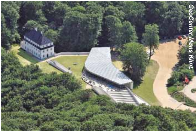
GeoCenter Møns Klint

Efter en lang tid med corona er det lykkes arrangement-udvalget at få stablet en sensommertur benene.