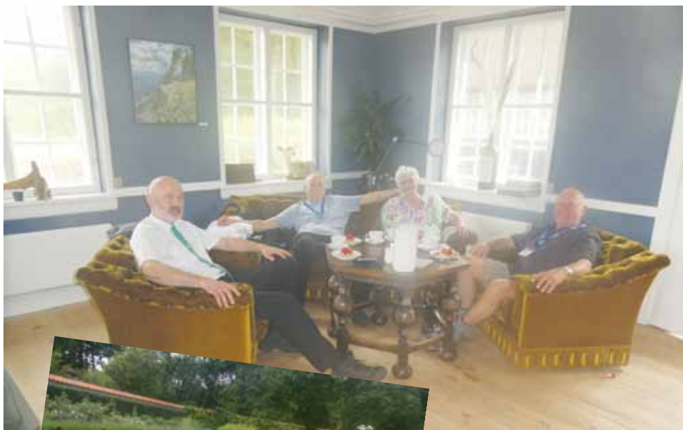
Kaffepause på Restaurant Borgen.

MEN, man skal dog ikke holde sig tilbage, selv om man er kørestolsbruger eller dårligt gående, da